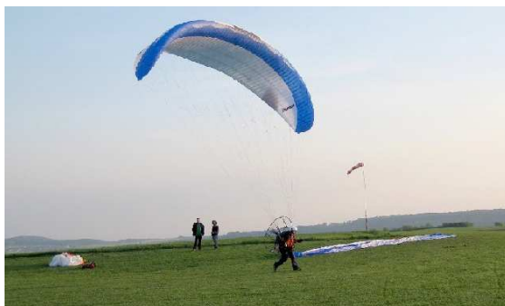
.....Start mit dem PLASMA

Der PLASMA lässt sich sehr gut führen und ist ein sehr moderner, aufwendig verarbeiteter Flügel. Der Schirm macht rundum eine sehr gute Figur bei allen Steuerleineneinsätzen, eben bis etwa Trimmerstellung + 3. Ab dieser Stufe wird bei weiterem Öffnen des Trimmers immer deutlicher, er will geradeaus und das schnell. Dafür hat er ja die zusätzlich in den Gurt eingebaute Stabilosteuerung (im Bild Nr. 3), die übrigens sehr leicht und effektiv funktioniert. Mit der Stabilosteuerung kann man den Normalflug recht gut kontrollieren und auch das Fliegen größerer Kurven ist so kein Problem. Will man es wieder direkter haben, dann eben die Trimmer bis etwa + 3 schließen und die Hände zurück an die Steuerleinen. Das geht nach einigen Flügen ganz automatisch in Fleisch und Blut über. Der PLASMA macht sauber das, was man von ihm will. Er lässt sich toll und direkt dirigieren und hat dabei auch eine akzeptable (nicht zu kurze) Steuerweglänge. Der Schirm setzt alle Steuerbefehle direkt kontrolliert um. Er liegt ruhig und satt in der Luft und vermittelt ein sicheres Gefühl.