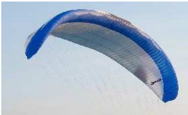
Bild PLASMA 26 RACE 2D

Was hat es auf sich mit der Bezeichnung 2 D? Wir kennen alle die Steuerleinenanlenkung links und rechts am Schirm, welche über die Spinne direkt auf die Hinterkante des Schirmes wirkt. So auch beim PLASMA, doch hier ist die äußere Stabiloleine (im Bild 1 die rote Leine) zusätzlich noch mit dem Steuerleinengriff verbunden. Wenn ich die Steuerleine nicht nur nach unten ziehe, sondern dabei auch zu mir (also nach innen), ziehe ich somit zusätzlich die äußere Stabiroleine und erhalte so ein sehr dynamisches Verhalten des Flügels. Da Reflexprofile eben auf schnelles und ruhiges Fliegen im Geradeausflug getrimmt sind, ist eben die Wendigkeit bei diesen Schirmen nicht so ausgeprägt. Angefügt ist ein Bild des Tragegurtes, wo eben auch diese spezielle Steuerleinen / Stabiloanlenkung sowie der Trimmer zu sehen sind (im Bild 1). Das funktioniert super, doch in Bodennähe Vorsicht! Wer dort plötzlich bei einer größeren, flachen Kurve in Bodennähe die Bremsleine zusätzlich nach innen zieht, darf sich über den folgenden schnellen Höhenverlust durch Abkippen des Flügels nach innen nicht wundern !