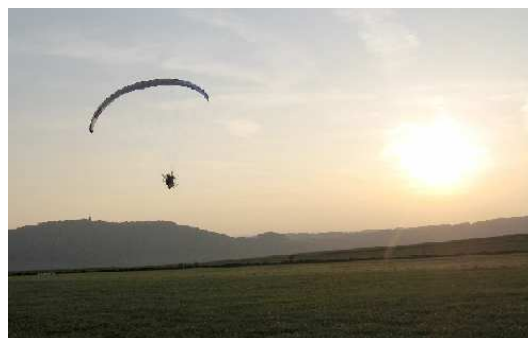
..nach wunderschönem Abendflug Landung in Korbach

Der PLASMA wird ausgeliefert mit einem Motortragegurt. Der Tragegurt ist sehr sauber verarbeitet und hat ein Trimmersystem mit Werten von – 4 über 0 (Neutral) bis + 11 und dazu noch ein Speed-System. Die Steuerkräfte sind nach meiner Meinung gut definiert. Als Pilot fühlt man sehr genau, was sich am Flügel tut und längere Streckenflüge werden so auch nicht zur Qual. Ich hatte Spaß mit dem Gerät und der Flügel war mir doch recht schnell vertraut. An die etwas längere und schnellere Startstrecke gewöhnt man sich (ist wegen der hohen Trimmgeschwindigkeit auch nicht anders zu erwarten). Der Flügel ist sehr sauber verarbeitet und wie ich finde auch optisch gelungen. In der Zwischenzeit bin ich Besitzer des PLASMA und fühle mich wohl. Mir macht dieser Flügel Spaß, richtig Spaß.