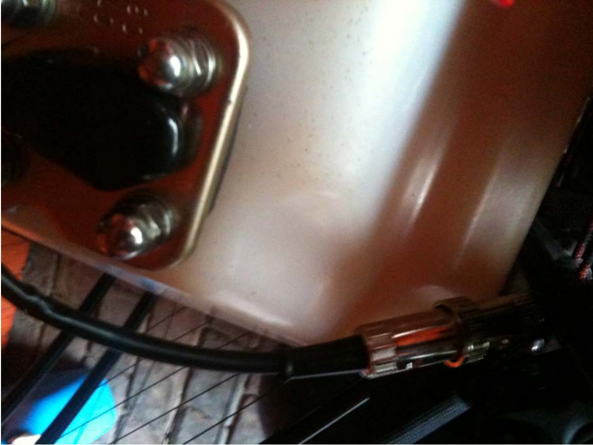
8 Stecker und Tankgeber