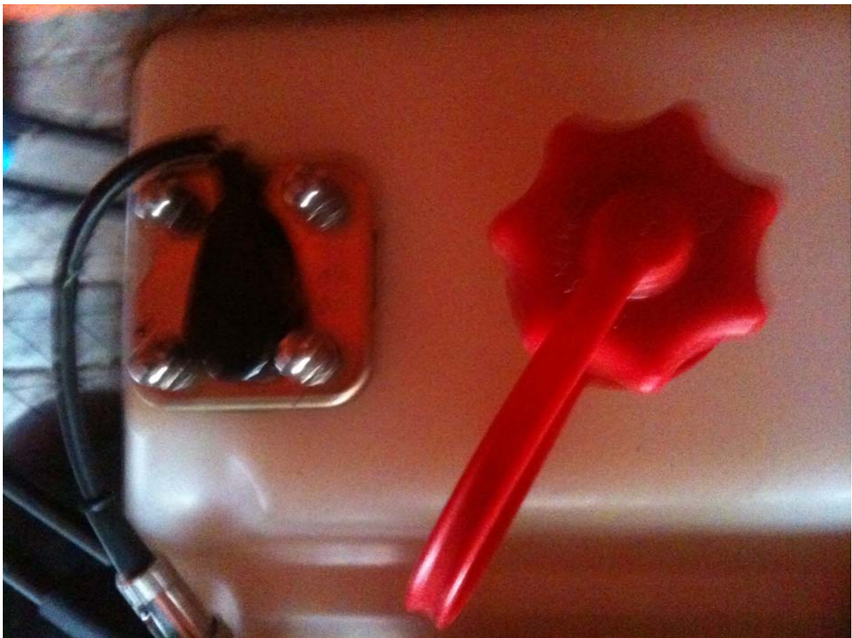
5 Lage Tankgeber

11. Tankanzeige im Cockpit oder wo auch immer installieren