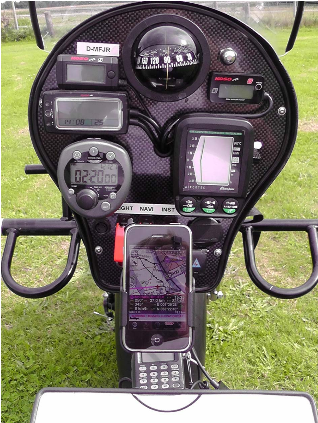
9 Tankanzeige oben rechts neben Kompass